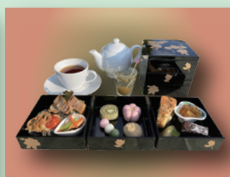
ガーデンカフェ栗林